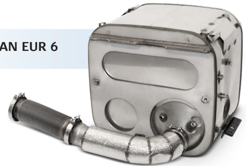
Lyddæmper MAN EUR 6