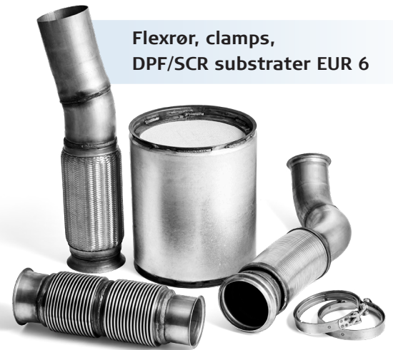
Flexrør, clamps, DPF/SCR substrater EUR 6